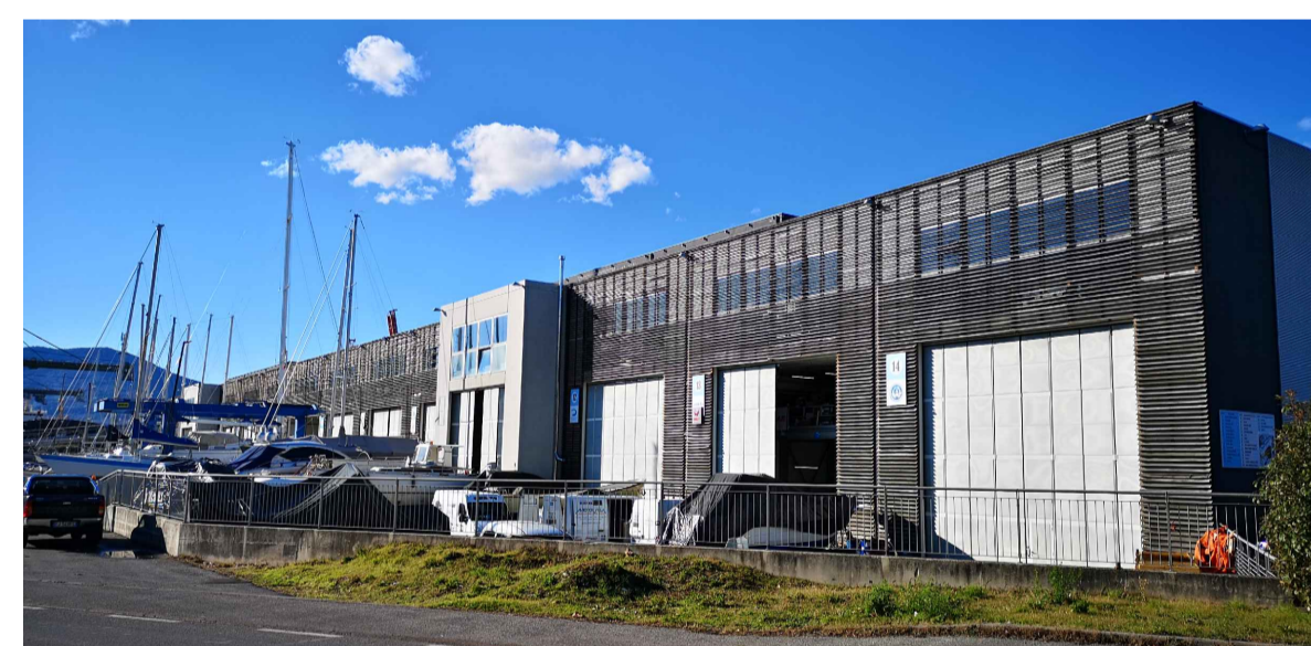
FOTO 11: Edifici artigianali nuova Darsena Pagliari - vista lato darsena