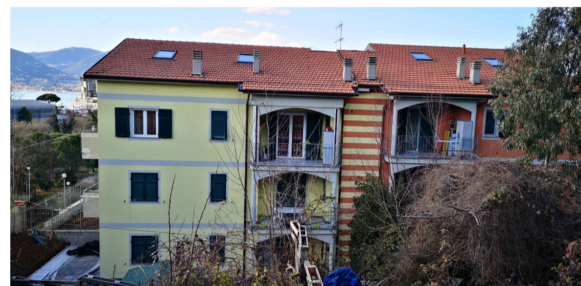
FOTO 10: Edifici residenziali all'interno del nucleo di Pagliari con tipologia in linea e plurifamiliare