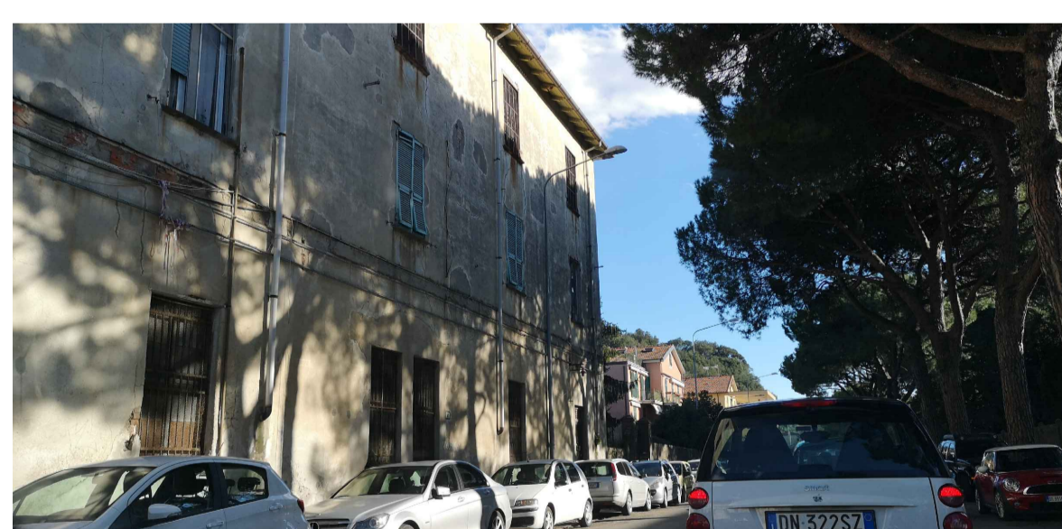
FOTO 5: Edifici a destinazione residenziale in area retro portuale con tipologia in linea e plurifamiliari