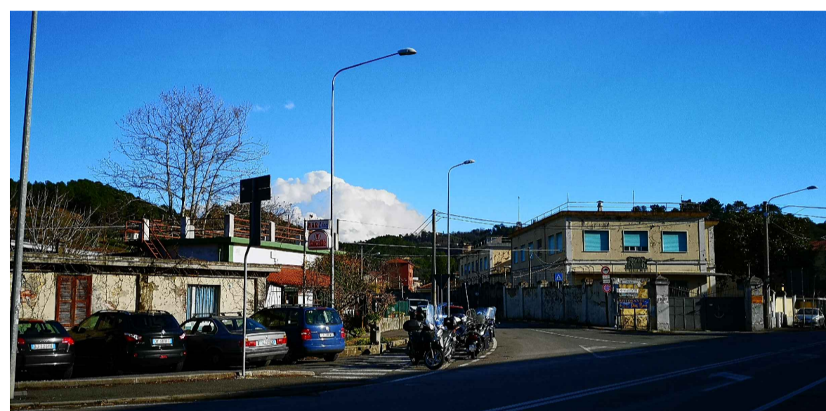
FOTO 3: Edifici artigianali in area retro portuale sulla sinistra; insediamento di tipo militare in disuso sulla destra