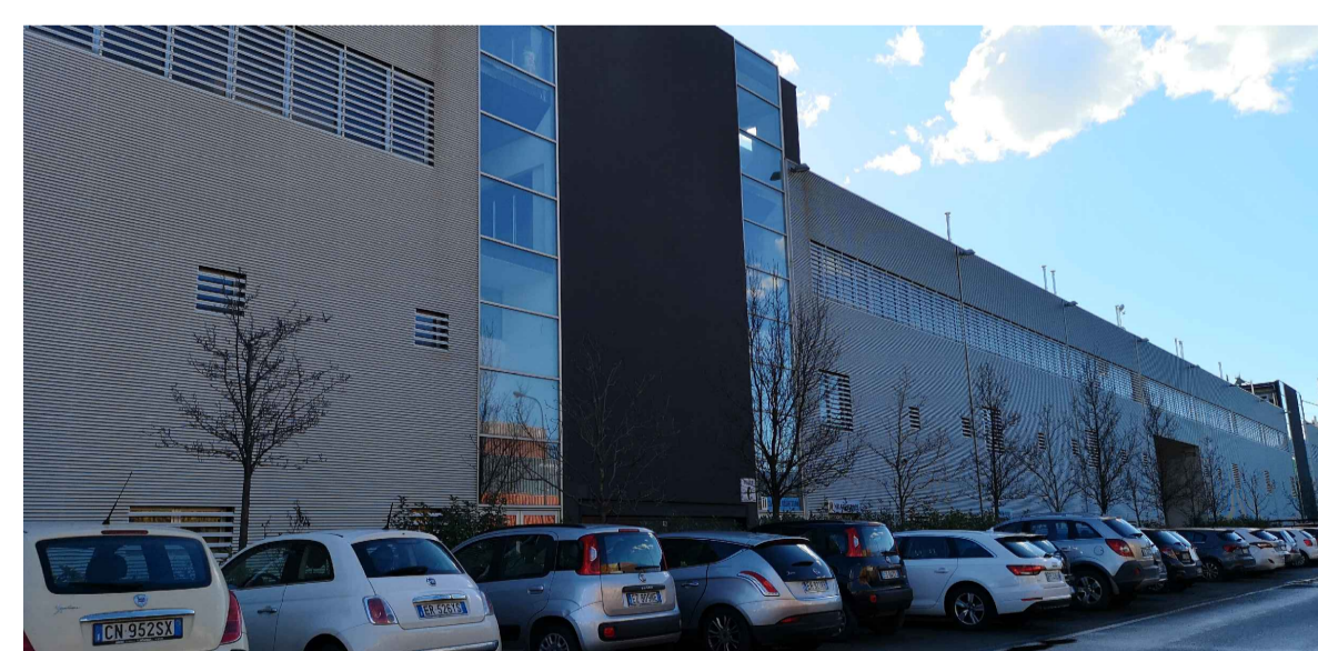
FOTO 12: Edifici artigianali nuova Darsena Pagliari - vista lato via delle Casermette