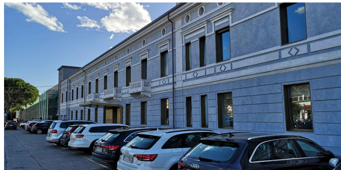
FOTO 4: Edificio artigianale e ufficio in area portuale facente parte del settore della nautica da diporto