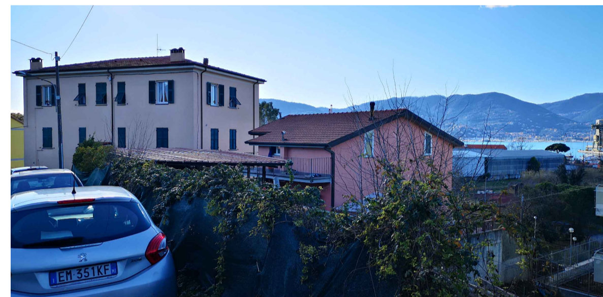
FOTO 9: Edifici residenziali all'interno del nucleo di Pagliari con tipologia in linea e plurifamiliare