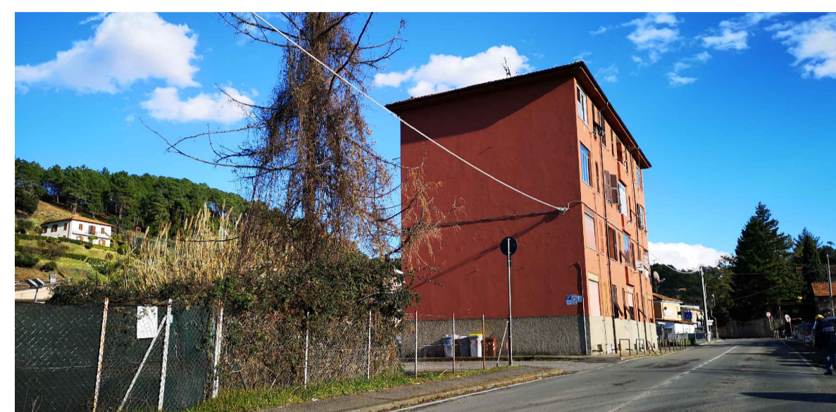
FOTO 8: Edifici a destinazione residenziale in area retro portuale con tipologia in linea