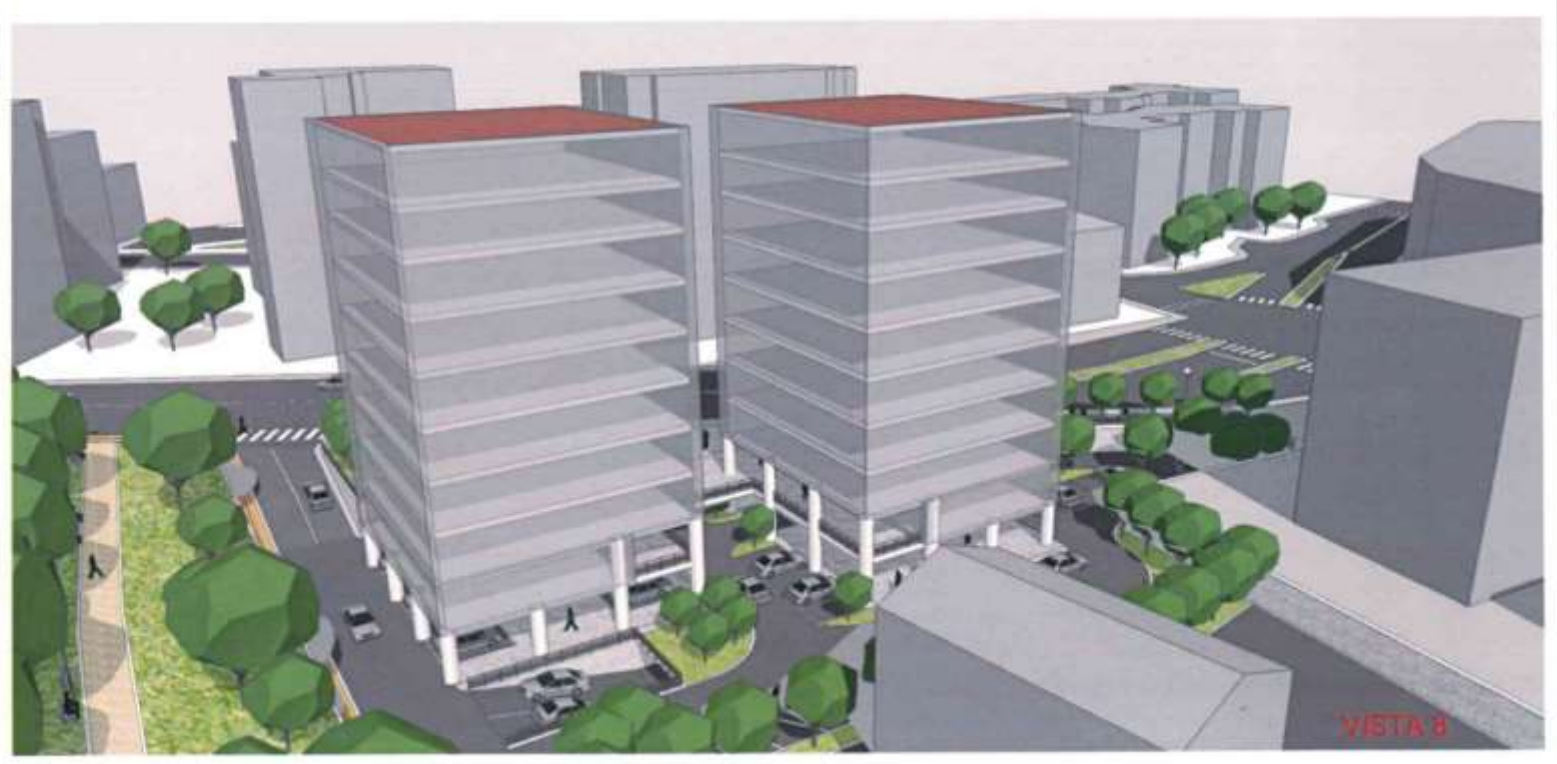
1 - SIMULAZIONE INTERVENTO