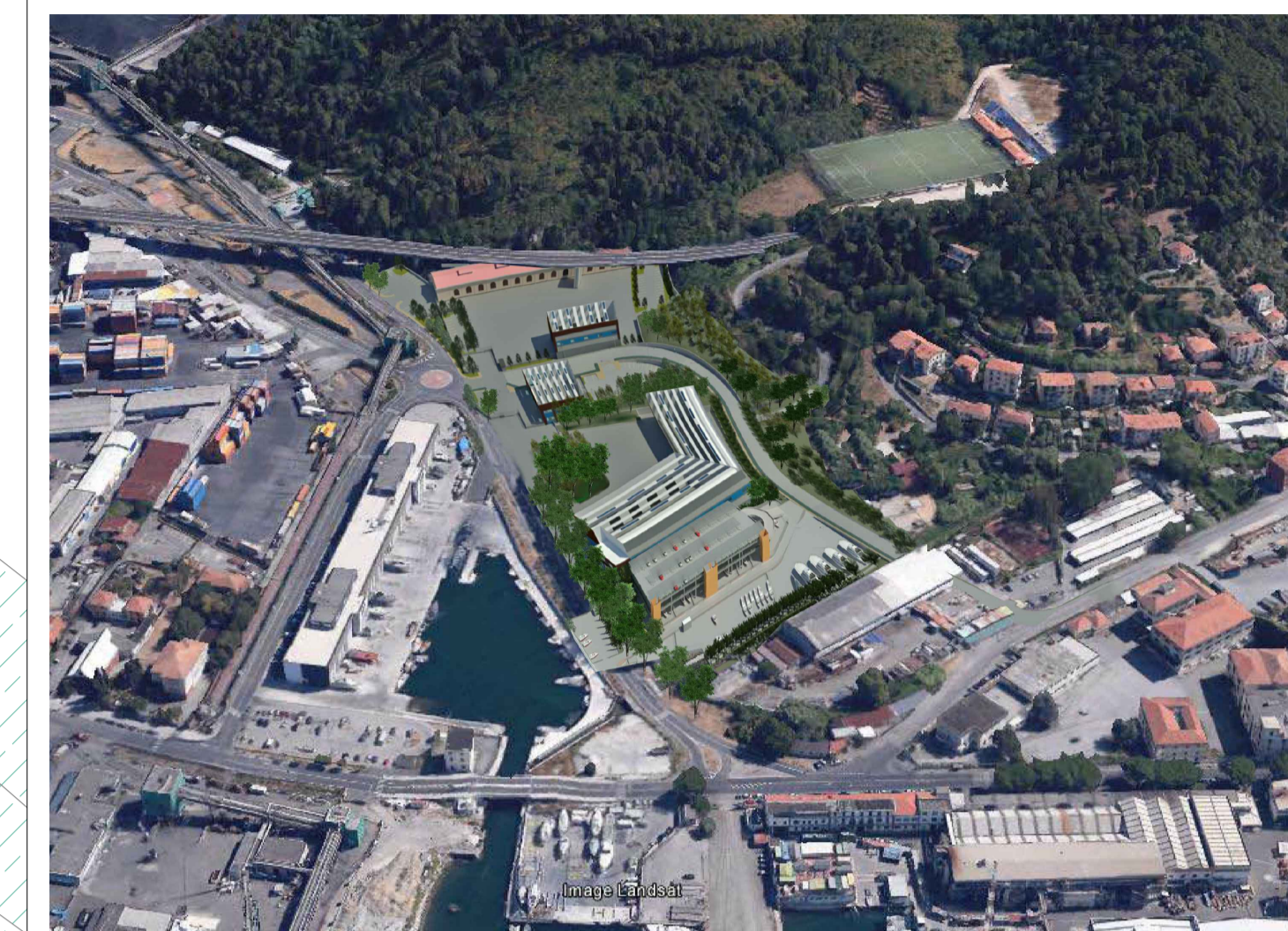
Fotoinserimento su immagine area