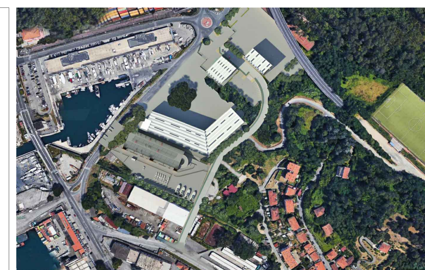
Fotoinserimento planovolumetrico di progetto