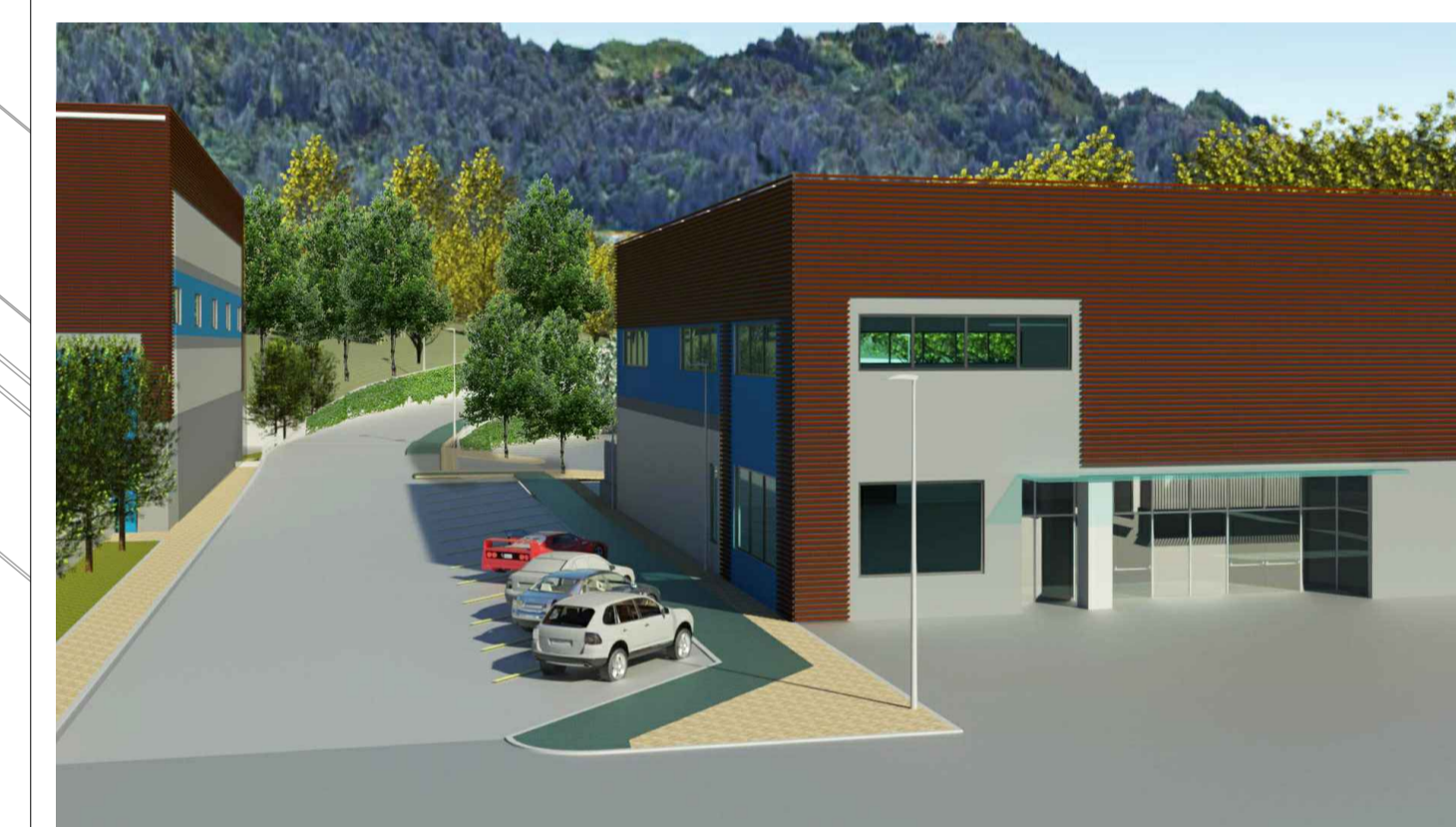
Fotoinserimento su vista dalla rotatoria di Via delle Casermette-Imbocco nuova strada