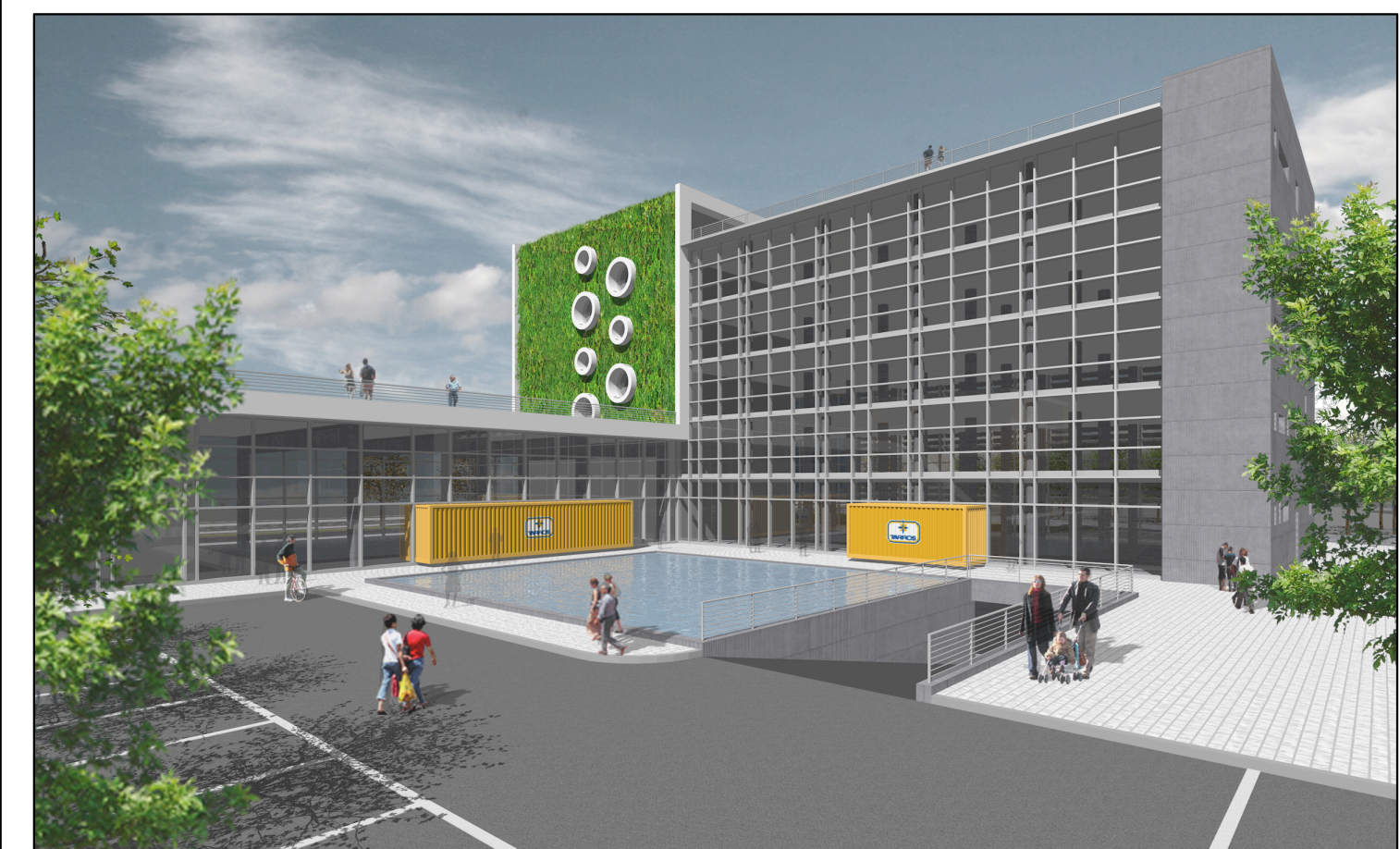
▼ Vista Lotto A da NORD