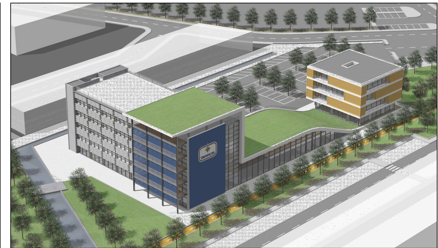
▲ Vista Lotto A da SUD