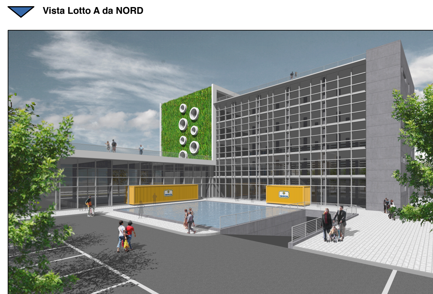
Vista Lotto A da NORD