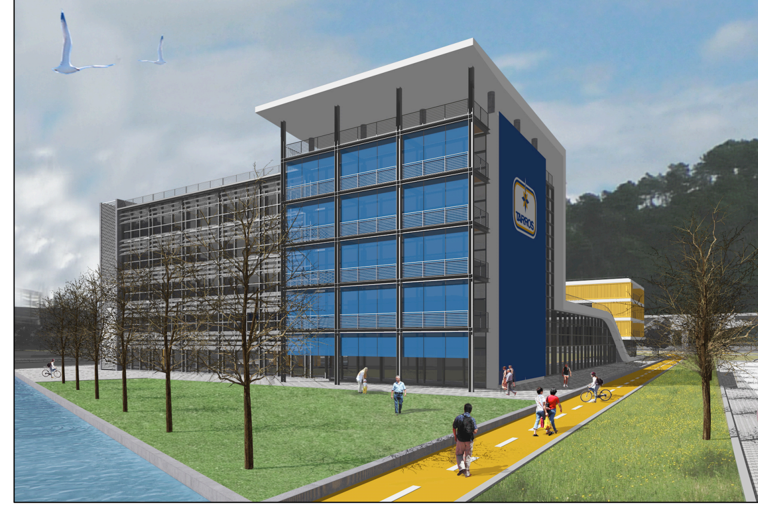
Vista Lotto A da SUD